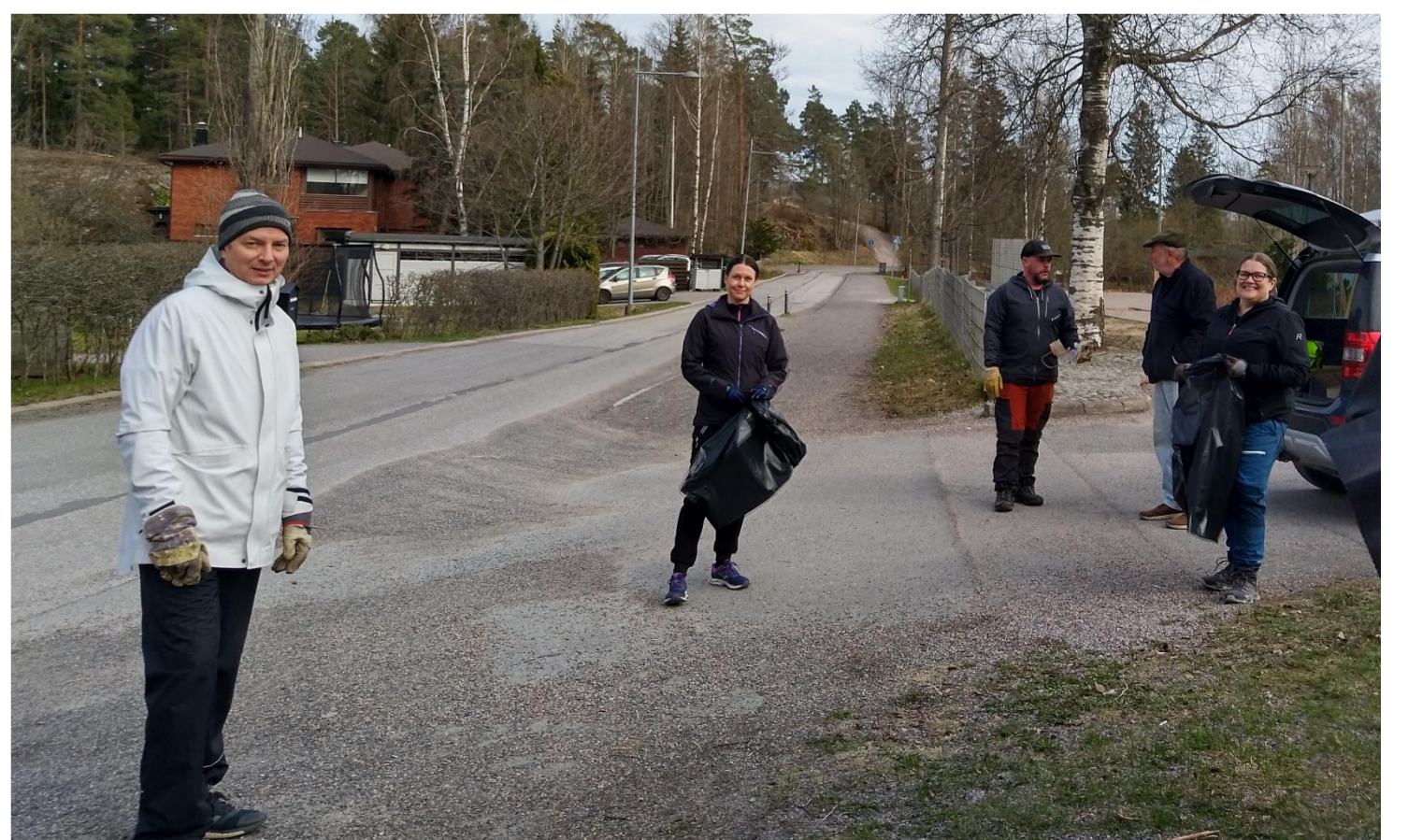
Siivoustalkoot ovat pitkäaikainen ja jatkuva perinne. Talkooporukkaa tehtävänjaossa Friisilän koululla 9.5.2022.