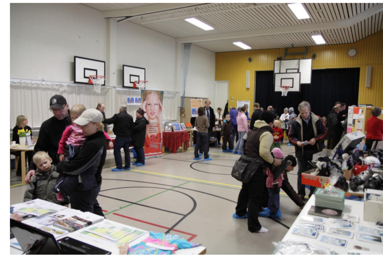
Friisilän messut järjestettiin 6.2.2010 Friisilän koululla. Näytteilleasettajia oli 13; mukana Friisilän Omakotiyhdistyksen lisäksi mm. Olarin Voimistelijat, Steiner-päiväkoti, korumyyjä, asunovälittäjä ja lennokkiharrastaja. Koulun sali täyttyi näytteilleasettajien pöydistä ja messuilla vieraili arviolta 250 kävijää.