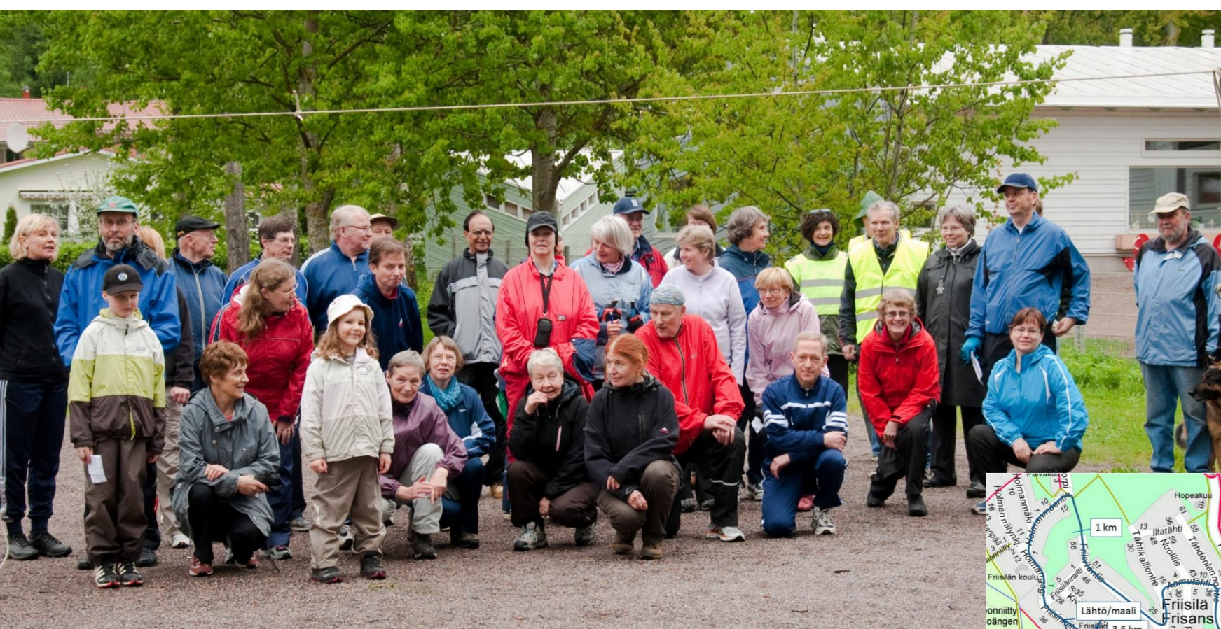
Friisilän hölkkätapahtuma järjestettiin toukokuussa 2010. Valmiina lähtöön! Päiväkodin lapset kiersivät myöhemmin saman reitin.