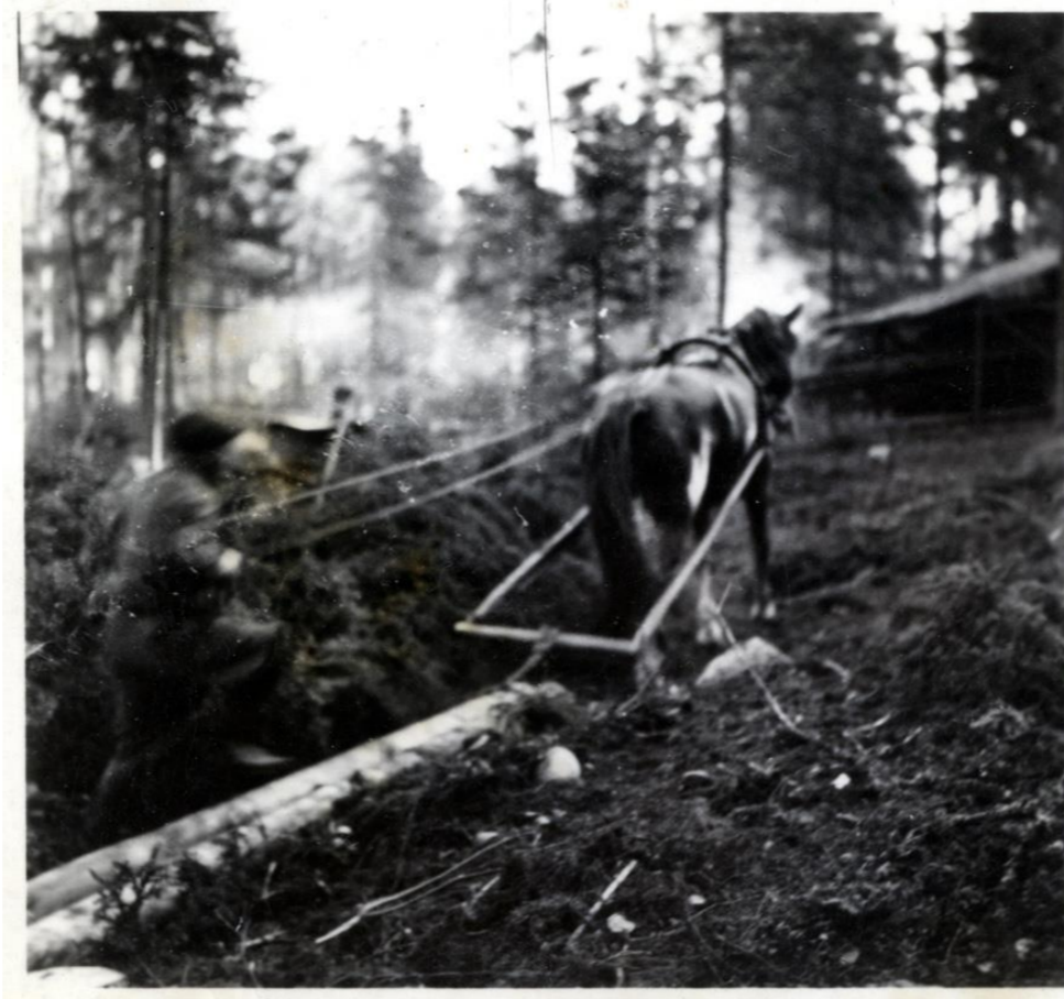
Veikko Kauhanen raivaa nyk. Friisiläntie 56:n tonttia v. 1950 tai -51