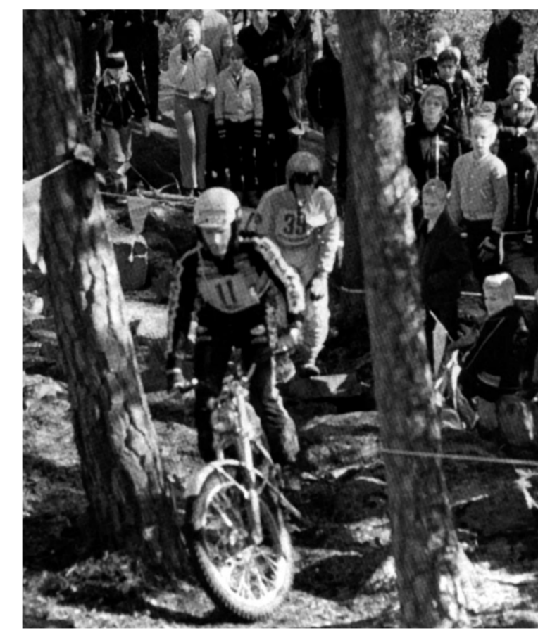
Trialin maailmanmestari Yrjö Vesterinen nosti 1970-luvulla Friisilän maailmankartalle tuomalla lajin MM-osakilpailun Friisinkalliolle.