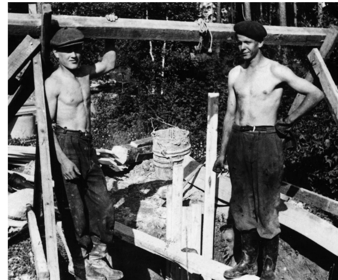
Nuolitiellä asuvan Lummaan perheen kaivoa syvennettiin vuonna 1950.