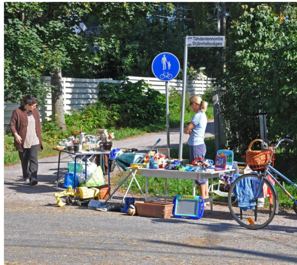
Yhteinen pihakirppispäivä järjestettiin 12.9.2009