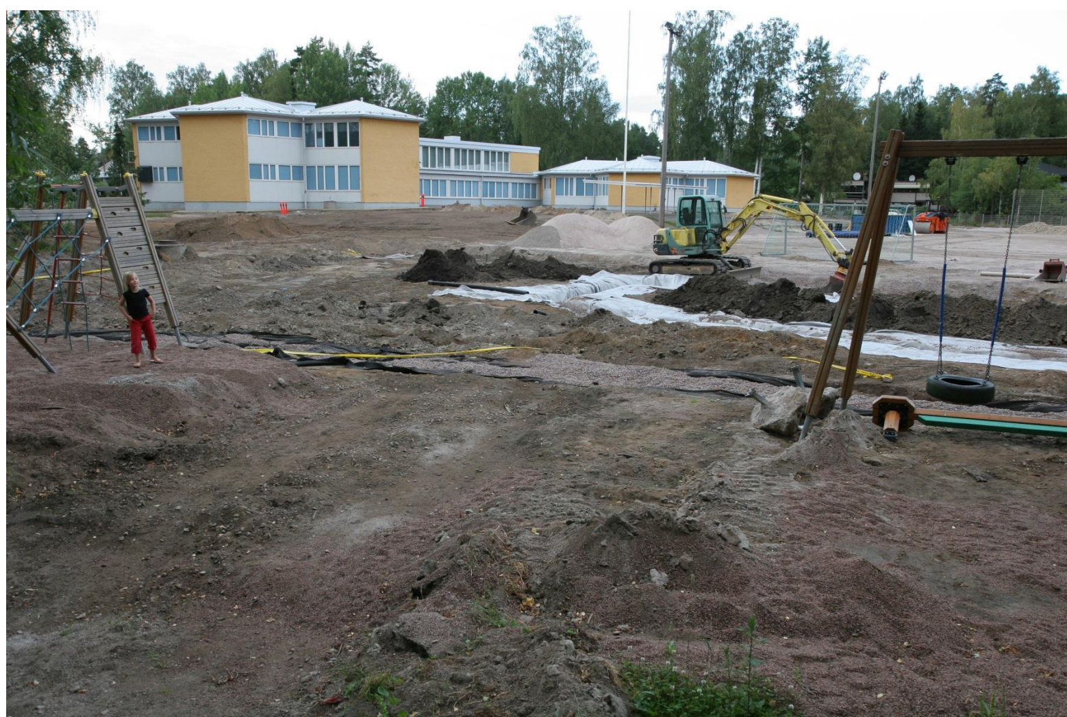
Koulun kenttä remontissa heinäkuussa 2006. Työn etenemistä tarkastelemissa koulun tuleva oppilas Hilla Pietiläinen.