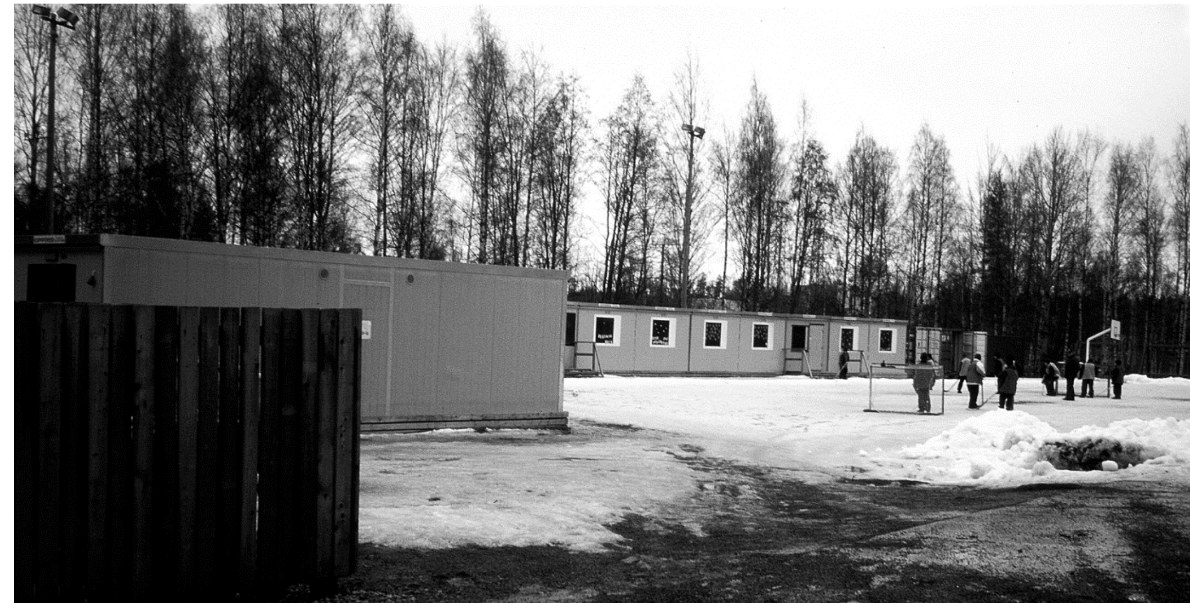
Friisilän koulun täyttäessä 40 vuotta 1999, siirtyi koulutyö peruskorjausten vuoksi vuodeksi parakkeihin.