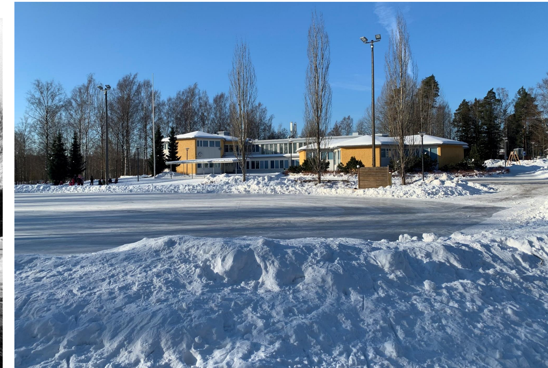
Talvisin kaupunki jäädyttää koulun kentän luistinradaksi friisiläisten vapaaseen käyttöön.