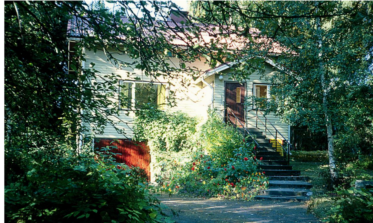
Tähtikalliontie 12. Talon edelleen pystyssä vuonna 2022.