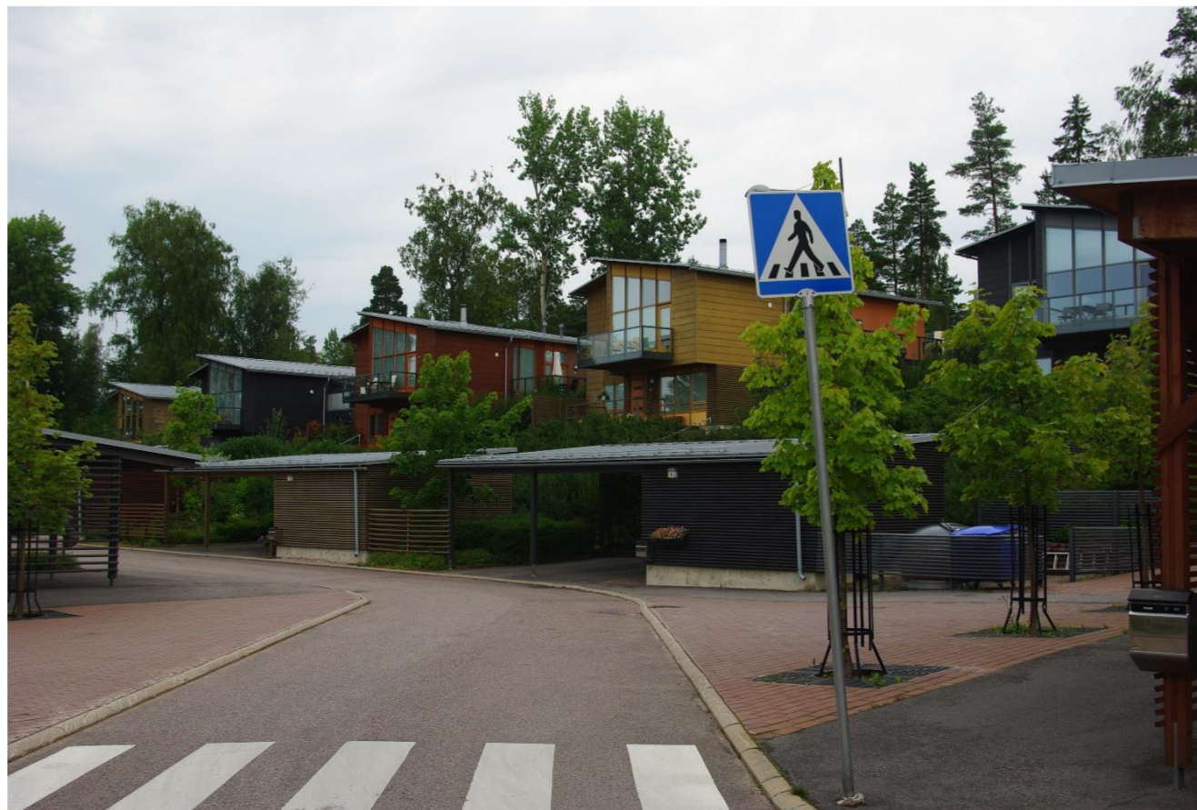
Aurinkorinne rakennettiin vuosina 2003-2004. Tässä vuoden 2010 kuosissa.