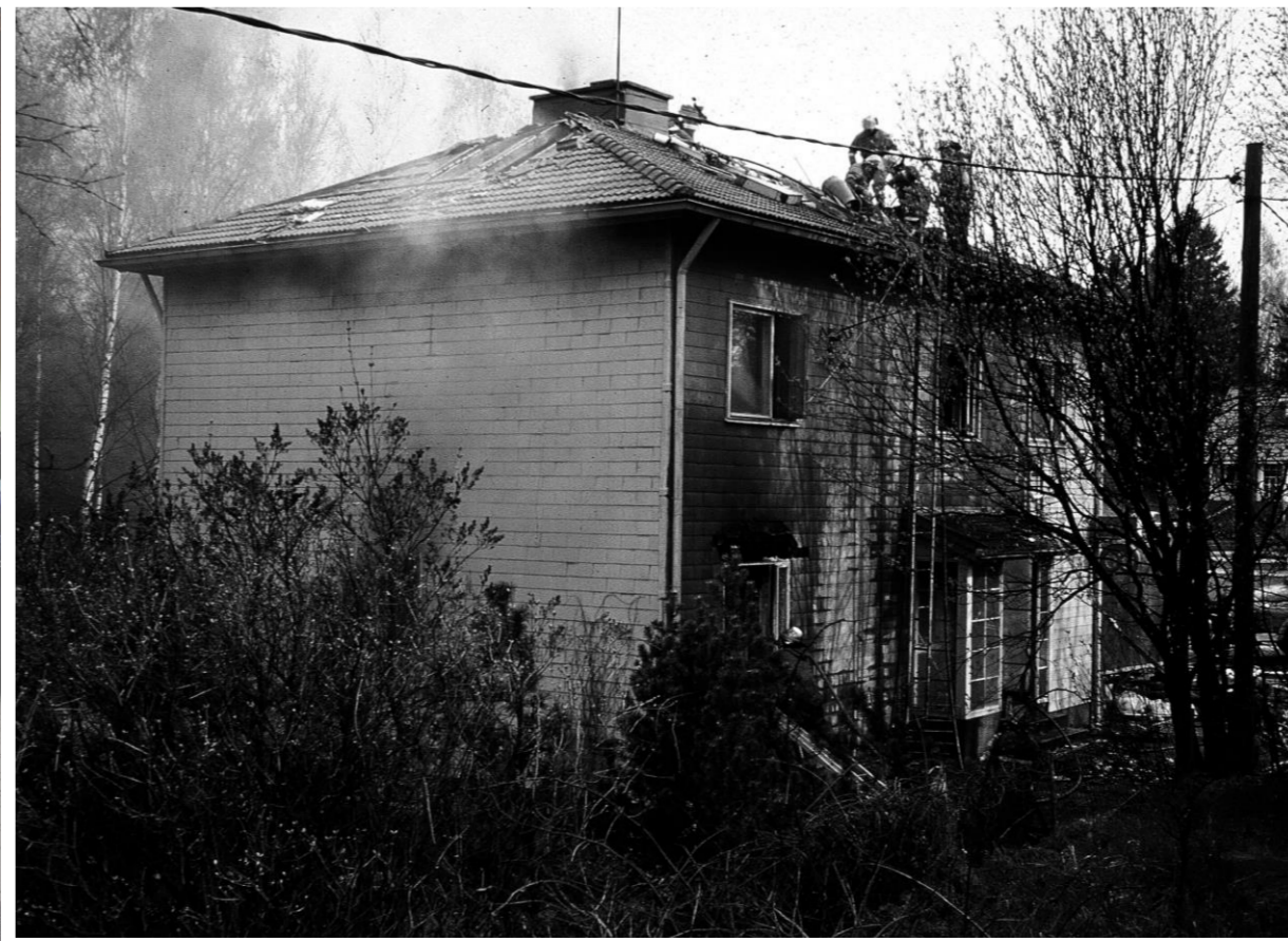
Tulipalot ovat valitettavan yleisiä Suomessa eikä Friisilä, ikävä kyllä, ole niiden suhteen poikkeus.