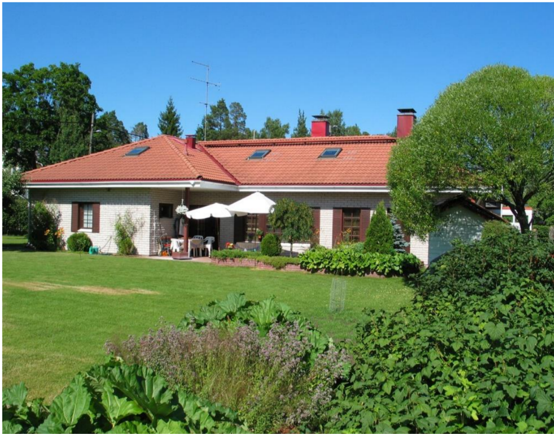
Nuolentie 48 heinäkuussa 2005.