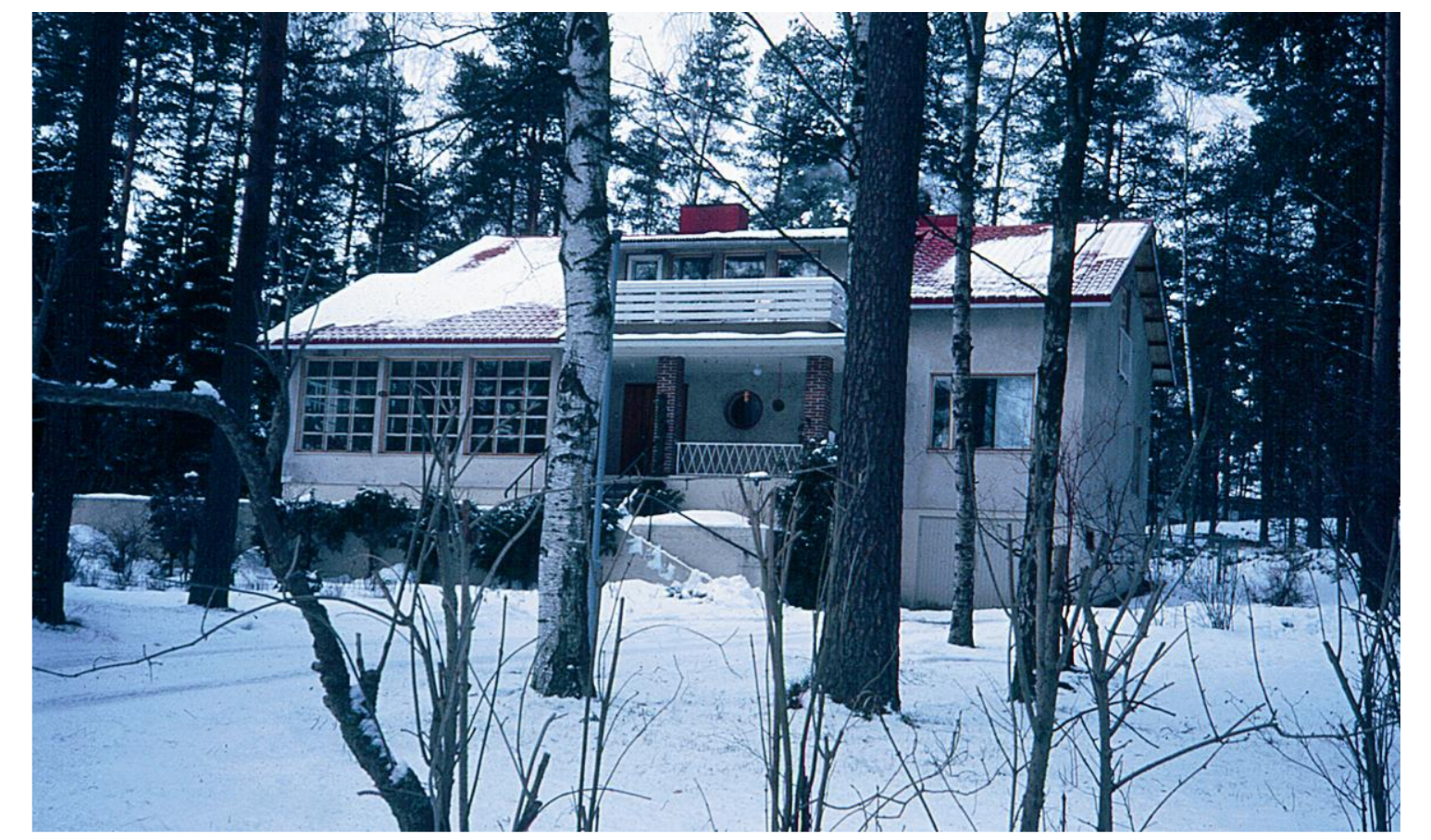
Volasen 1940-luvun lopulla rakennuttama komea talo Tähtenlentontie 12-14:ssä erottui aikoinaan selvästi mökkikylän muista rakennelmista. Frisansilaiset kävellyttivät vieraansakin paikallisena nähtävyytenä pidetyn talon ohi. Paikalla on nykyään punatiinen rivitaloyhtiö.