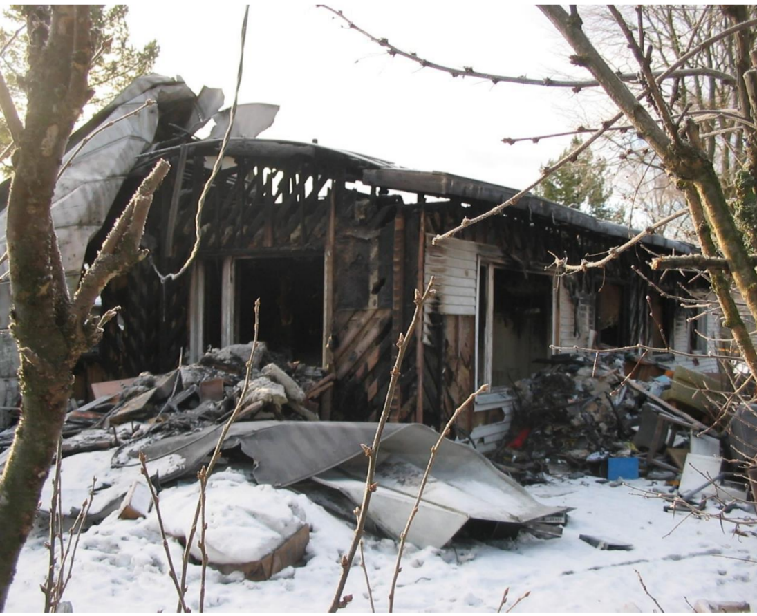
Friisinniityntielle rajuissa palossa menehtyi yksi ihminen vuonna 2005.