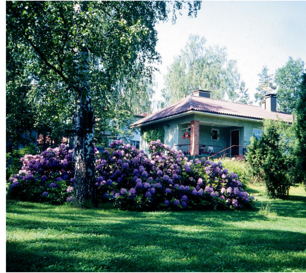
Friisiläntie 22. Rakennus on edelleen pystyssä vuonna 2022.