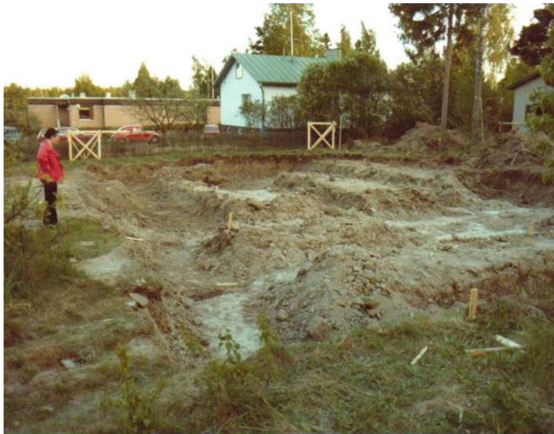
Airi Hallikainen tarkastelee Nuolentie 48:n perustuskuoppaa kesällä 1978.